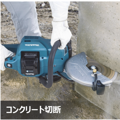
コンクリート切断

パワーカッタは、石工現場や水道工事、災害救助などの現場において、大型のコンクリートや鑄鉄管をはじめとした各種材料を大径の刃物で切断する工具です。このたび発売する「CE003G/CE004G」は、軽量・コンパクトながらも高速かつパワフルな切断を可能にした充電式パワーカッタで、CE003G は刃物径を 230mm、CE004G は 305mm としています。エンジン式と異なり酸素不足でも確実に始動するといったメリットがあり、排気ガスを出さないため、屋内や地下などの環境下でも使用できます。