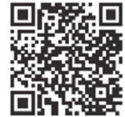
QRコードより MUC028G/029G の動画がご覧になれます。